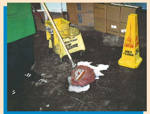
Limpie los derrames