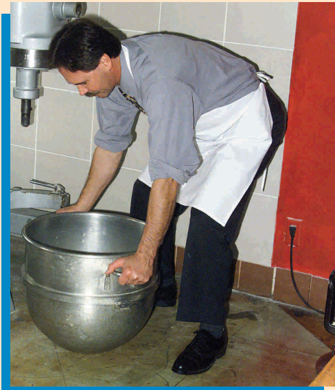
No doble su espalda.

Para empresas pequeñas - restaurante y bar.