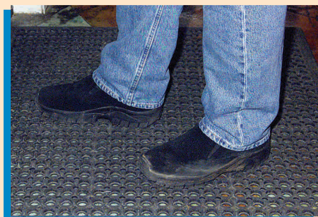
Use calzado cerrado y con buen soporte.

Para aprender más sobre la seguridad en el trabajo y recibir publicaciones gratis, por favor llame a nuestro número gratuito: 1-800-963-9424 o entre a la página de Internet: www.dir.ca.gov/dosh/puborder.asp