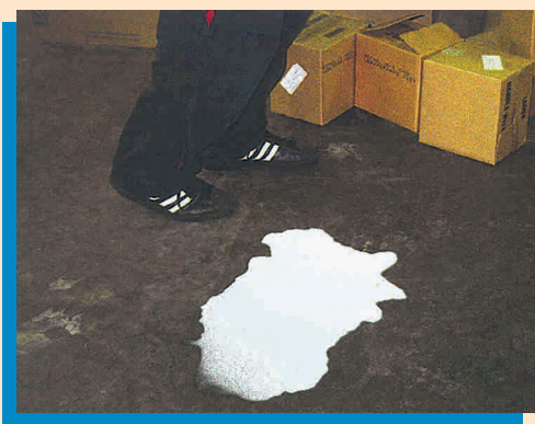
No deje sucia el área de trabajo.