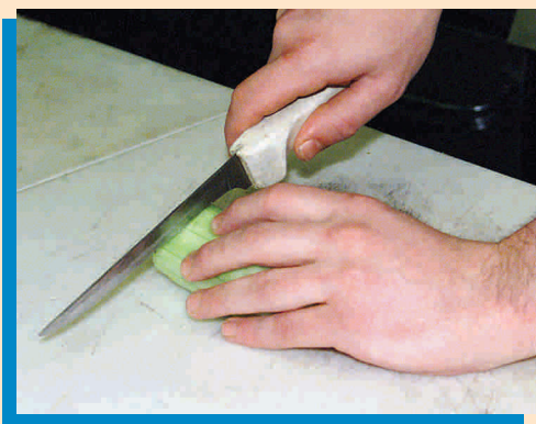
No interponga sus dedos al cuchillo.