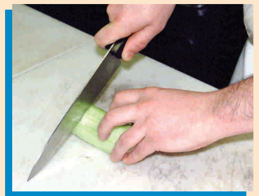
Elija el cuchillo apropiado, controle el cuchillo y el producto.