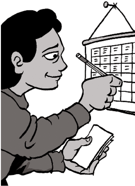
記錄您的工作時數。

僱主還應在僱員容易看到和讀到的地方（例如休息室）張貼職業或行業適用的本州工資法令。