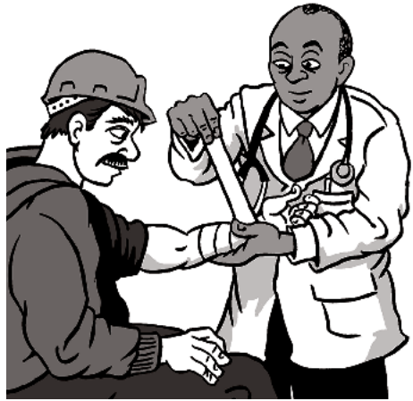
如果受傷，您有權獲得醫療服務。